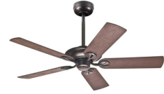
Ventilador de techo